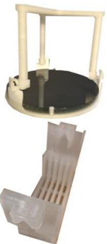
Accessoire : panier wafer imprimé en PP ou PVDF