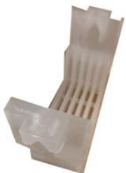
Panier porte masques poignée plongeante