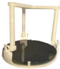
Panier wafer imprimé en PP ou PVDF