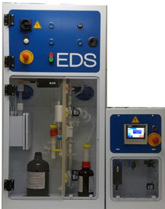
Armoire de distribution